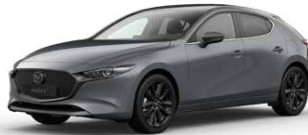
POLYMETAL GRAY METALLIC