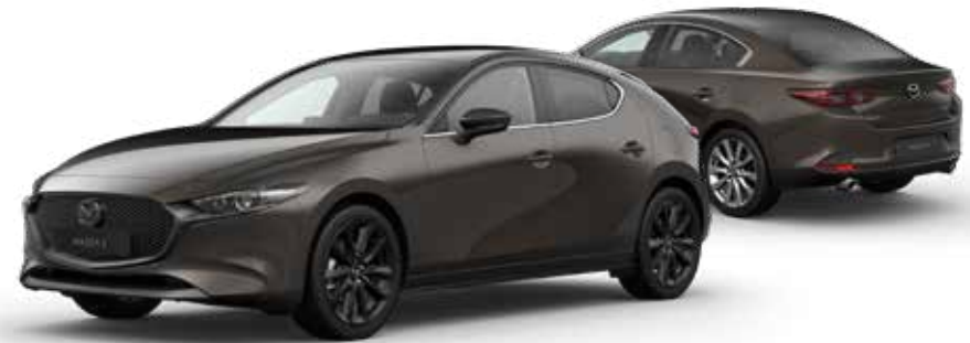
TITANIUM FLASH MICA