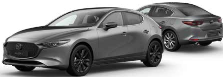
MACHINE GRAY METALLIC