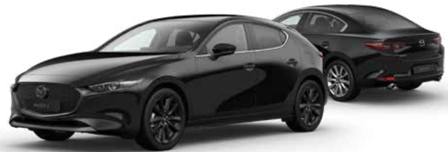
JET BLACK MICA