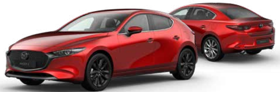
SOUL RED CRYSTAL METALLIC