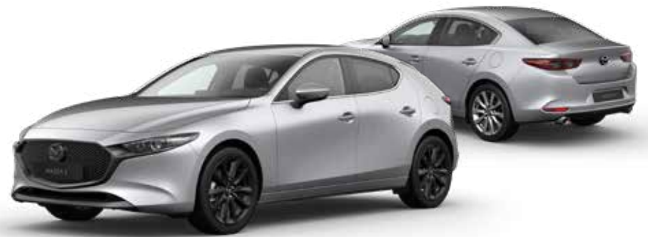
SONIC SILVER METALLIC