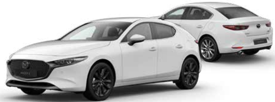
ARCTIC WHITE SOLID

U hebt keuze uit negen kleuren. De basiskleur is Arctic White Solid. De meest exclusieve kleuren zijn Machine Gray Metallic en Soul Red Crystal Metallic. Hierbij zorgt een speciale laktechniek met nog kleinere en helderder aluminium deeltjes voor een ongekend diepe, heldere kleur en een prachtige glans. Met deze intensieve kleuren blinkt uw Mazda3 als een spiegel en is hij nog meer een eyecatcher.