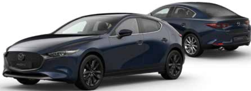
DEEP CRYSTAL BLUE MICA