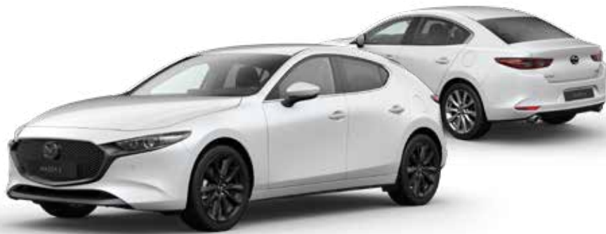
SNOWFLAKE WHITE PEARL